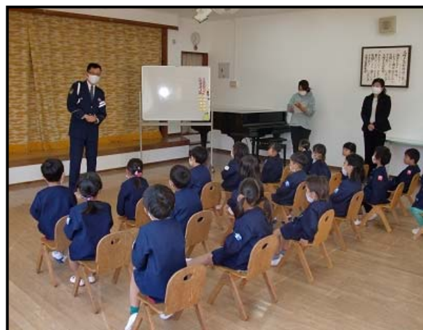
大崎上島幼稚園交通安全教室 令和3年4月