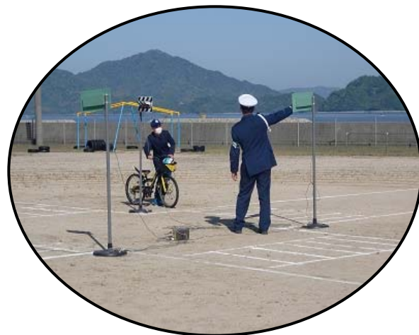
木江小学校交通安全教室 (自転車点検・乗り方) 令和3年4月