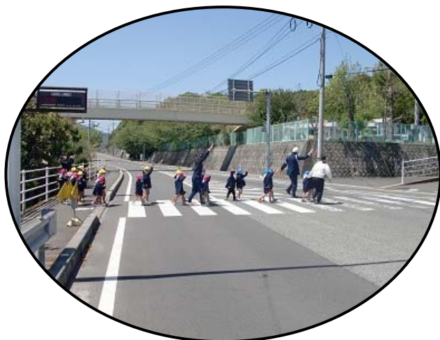
大崎上島幼稚園交通安全教室 (横断歩道の正しい渡り方) 令和3年4月