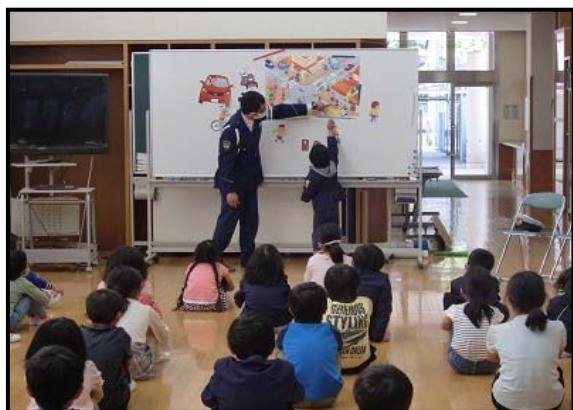
木江小学校交通安全教室 令和3年4月