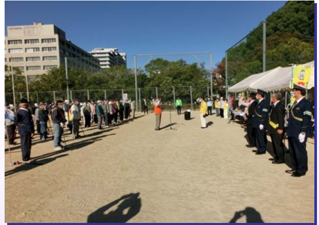
交通安全グランドゴルフ大会