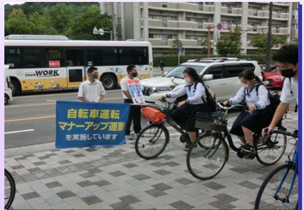
高校生参加の自転車街頭指導