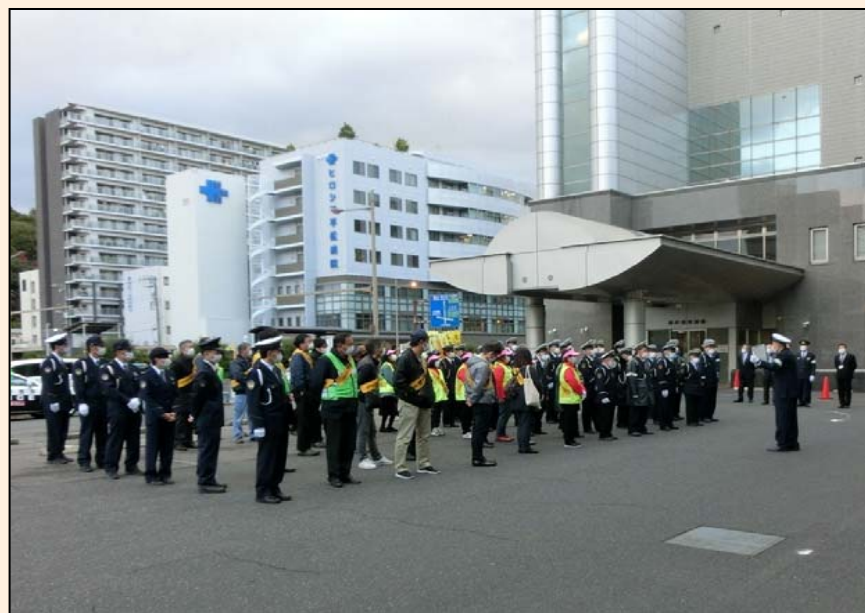
令和3年12月 年末交通事故防止県民総ぐるみ運動 (南区役所別館前)

広島南交通安全協会は、皆様方に交通安全協会へのご加入をお願いしています。 皆様の会費（年間500円）は、地域の交通安全活動のために使われています。