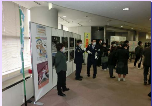
交通事故パネルの展示