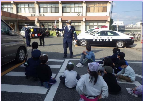
児童と保護者の交通安全教育