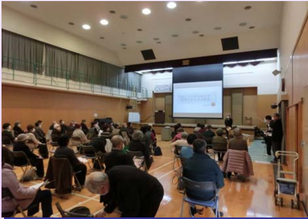
高齢者交通安全講習