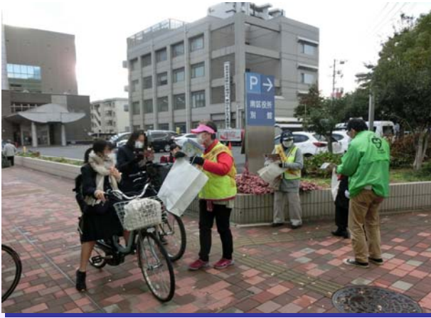
県民総ぐるみ運動街頭キャンペーン