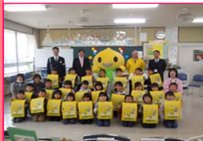
ランドセルカバー贈呈式