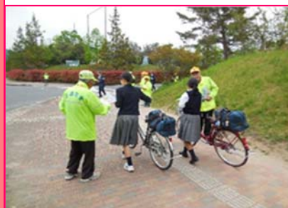
自転車マナーアップ月間

交通安全協会へは、免許証の取得時や更新時にご入会をお願いしております。 中途入会も可能です。詳しくは、お問合せ下さい。