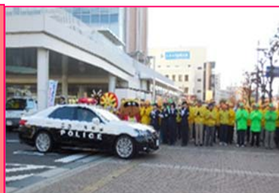
交通安全運動出発式